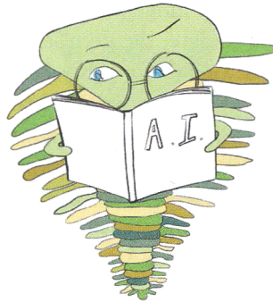
Abb. 3 Der lesende Trilobit hat Freude daran, Ihr Wissen zu erweitern.

Überall im Buch finden Sie freundliche Trilobiten, die Ihnen gern kleine Schnipsel nicht ganz so notwendiger Informationen anbieten möchten, die für Sie vielleicht dennoch interessant oder hilfreich sein könnten. Der lesende Trilobit (wie in Abbildung 3) ist ein Bücherwurm, der Freude daran hat, Ihr Wissen zu erweitern. Der Trilobit, der um Ihre Aufmerksamkeit bittet (wie in Abbildung 4), hat eine Textpassage bemerkt, die möglicherweise problematisch für Sie ist, und würde in dieser Situation gern helfen. Zusätzlich zu den Trilobiten, die die Kästen bevölkern, haben wir reichlich Gebrauch von Fußnoten gemacht. Diese müssen Sie nicht unbedingt lesen, aber sie enthalten kurze Erklärungen neuer Begriffe und Abkürzungen sowie Quellenangaben zu wichtigen Artikeln, Büchern und anderen Referenzen, die Sie bei Interesse bemühen können.