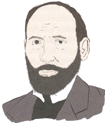
Abb. 1 Santiago Cajal (1852–1934)

ning die Genauigkeit vieler durch Computer erledigter Aufgaben von 95 Prozent auf teils mehr als 99 Prozent verbessert – die entscheidenden Prozentpunkte, die dafür sorgen, dass ein automatisierter Dienst sich tatsächlich anfühlt, als würde er von Zauberhand ausgeführt werden. Auch wenn die in diesem Buch gelieferten interaktiven Codebeispiele die vorgebliche Magie entzaubern, verschafft das Deep Learning den Maschinen eine übermenschliche Fähigkeit bei komplexen Aufgaben, die so verschieden sind wie das Erkennen von Gesichtern, das Zusammenfassen von Texten und das Spielen schwieriger Brettspiele. 2 Angesichts dieser markanten Fortschritte überrascht es kaum, dass »Deep Learning« gleichgesetzt wird mit »künstlicher Intelligenz« – in der Presse, am Arbeitsplatz und zu Hause.