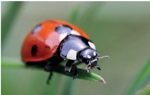
Abb. 3.13 Ein Insektenmakro bringt man nicht zwingend mit »AI Servo« in Verbindung. Doch gerade bei freihändiger Makrofotografie ist »Servo« durchaus sinnvoll.

Das erste Bildbeispiel zeigt einen Marienkäfer auf einem Grashalm. Da Makros immer unter der knappen Schärfentiefe leiden, ist es die wichtigste (und schwerste) Aufgabe, den Fokus wirklich präzise an den gewünschten Punkt zu setzen – hier ist es der Kopf mit seinen feinen Härchen. Auf dem Foto selbst ist nicht zu erkennen, dass zur Zeit der Aufnahme etwas Wind wehte. Der Grashalm schaukelte leicht, und der Käfer hat auch nicht wirklich stillgehalten. Das war zu viel Bewegung für One Shot , Servo konnte die Bewegung des Halmes und der freihändig gehaltenen Kamera dagegen kompensieren. Als Autofokus-Methode habe ich den erweiterten Autofokus verwendet. Diese Methode funktioniert im Grunde wie der Einzelbild-Autofokus – die Umgebungsfelder