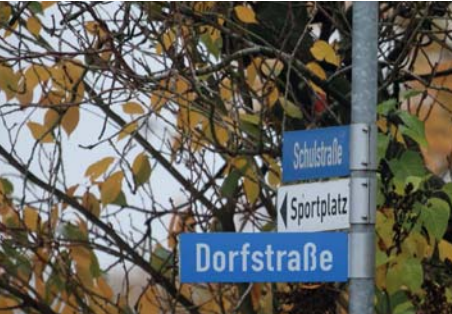
Abb. 3.2 Ein Beispiel für die Leistungsfähigkeit des EOS R5-Autofokus: Zum Testen habe ich ein 150-600-mm-Objektiv mit einem 2x-Konverter an die EOS R5 montiert (resultierende Brennweite: 1.200 mm). Kein Autofokus einer DSLR würde hier noch mitspielen. Die EOS R5 hat klaglos und präzise fokussiert, trotz einer Offenblende von f/13. Sie sehen hier übrigens eine Aufnahme, die mit ISO 12.800 gemacht wurde.

Die Phasenmessung von DSLR-Kameras benötigt aus physikalischen Gründen bestimmte Offenblenden-Werte. Bei f/2,8 funktionieren alle Autofokus-Felder, bei f/4 gibt es manchmal erste Einschränkungen, f/5,6 ist das aktuelle Minimum für umfangreiche Autofokus-Funktionen, und erst die Kameras der letzten zwei Generationen können bei f/8 wenigstens noch einige zentrale Autofokus-Felder nutzen.