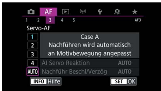
Abb. 3.4 Das dritte Register des violetten Autofokus-Menüs zeigt die fünf Cases. Vier davon können Sie nach Ihren Präferenzen anpassen.