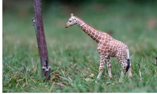
Abb. 3.6 Von links kommt ein Baum ins Bild. Solange er nicht im Erfassungsbereich der Autofokus-Felder liegt, wird die Kamera ihn ignorieren.