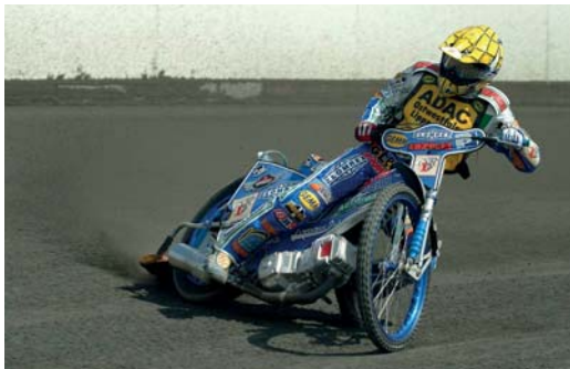
Abb. 3.15 Case 1 erlaubt eine saubere Nachführung der Bewegung, wenn sich das Motiv konstant und vorhersehbar bewegt.

sind nur eine zusätzliche Absicherung, falls der Autofokus vom Ziel abrutscht, was im vorliegenden Fall wenig wahrscheinlich ist.