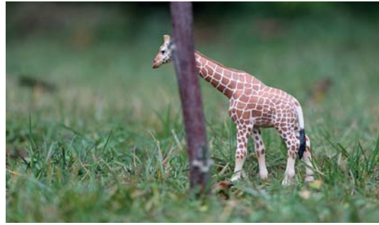
Abb. 3.8 Der Baum verdeckt die Giraffe. Nun kommt es auf die Einstellung an. Bei negativen Werten für »AI Servo Reaktion« bleibt der Fokus auf der Giraffe.