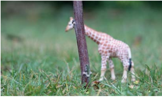
Abb. 3.7 Bei positiven Werten wird der Autofokus sofort auf den Baum wechseln, weil der Baum näher an der Kamera ist. Sie verlieren die Giraffe aus dem Fokus.