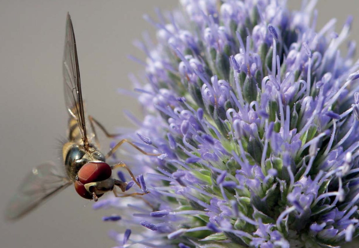
Abb. 3.12 In den Modi Verfolgung (alle Felder)/ Motiverkennung und den drei Zonen unterstützt die Mustererkennung den Autofokus wesentlich. Was Wenige wissen: Der Sensor erkennt nicht nur Augen, Gesichter und Tiere, sondern ist auch in der Lage, spezifischen Mustern zu folgen, die der Sensor an der Stelle der Schärfe erkannt hat.

ten Werten entspricht, und übernimmt dann dessen Fokussierung.