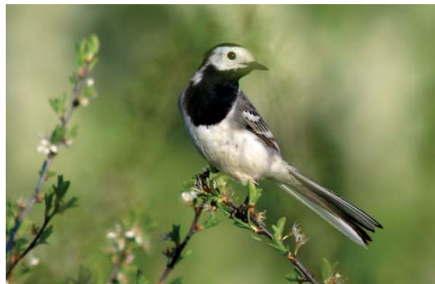
Abb. 3.25 Obwohl der Vogel teilweise von Blättern verdeckt war, wurde er korrekt erkannt und vom AF sauber fokussiert. Ohne Tiererkennung läge der Fokus auf den vorderen Blättern.