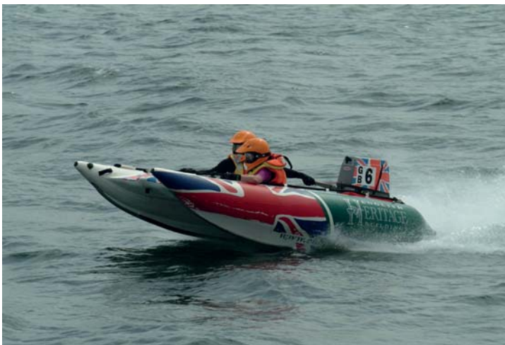
Abb. 3.19 Die konstante Bewegungsrichtung lässt sich bei diesem Rennboot gut verfolgen, bedingt durch die Wellen kann es aber zu heftigen vertikalen Sprüngen kommen, so dass die Autofokus-Felder immer mal den Kontakt verlieren. Case 2 hält den Autofokus auf dem Ziel.

Es gibt bewegte Motive, bei denen sich die Distanz zur Kamera nur wenig verändert. Solange das Motiv im Bereich der Schärfentiefe bleibt (abhängig von der Blende und der Brennweite), wäre die Autofokus-Betriebsart One Shot zusammen mit dem Schließen der Blende zur Erweiterung der Schärfentiefe durchaus eine praktikable Lösung.