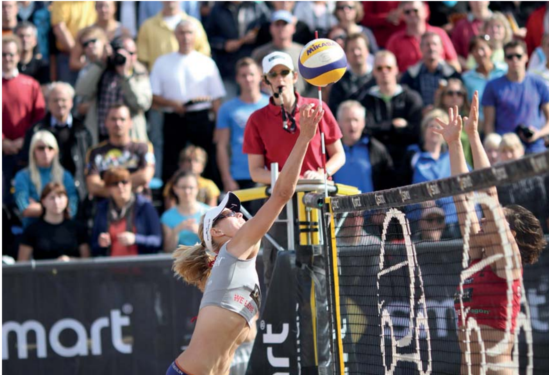
Abb. 3.18 Der diagonale Bildaufbau und vor allem die Staffe­lung der Personen in der Tiefe sind für alle Autofokus-Zonen problematisch, insbesondere wenn die Gesichtserkennung aktiv ist. Es ist besser, hier mit Einzelfeld und Umgebung zu arbeiten.

Die Einstellungen von Case 2 verhindern, dass kleine Hindernisse oder das ungewollte »Abrutschen« des Messfeldes vom Motiv einen sofortigen Schärfeverlust zur Folge haben.