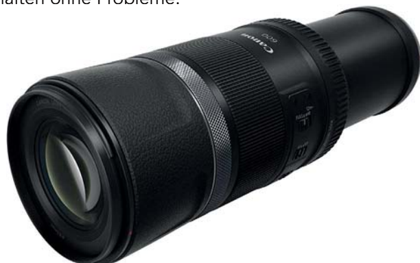
Abb. 3.3 Objektive wie das RF 600/11 IS STM würden an einer DSLR nicht mit Autofokus funktionieren – an einer EOS R5 tun sie dies jedoch ohne Probleme.

Der Einsatz von Optiken mit solch kleiner Offenblende benötigt entweder viel Licht oder aber eine Kamera, die mit hohen ISO-Einstellungen gut umgehen kann. Das ermöglicht auch die Konstruktion von Objektiven wie dem RF 600/11 IS STM. Ein kleiner Vergleich: Das EF 600/4 III L IS USM wiegt 3 kg und kostet rund 13.500 Euro. Das RF 600/11 IS hat dieselbe Brennweite, wiegt nur 900 Gramm und ist derzeit für rund 800 Euro zu bekommen. Die drei Blendenstufen Unterschied kompensiert die EOS R5 mit ihrem sehr guten Rauschverhalten ohne Probleme.