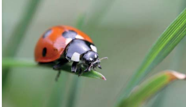
Abb. 3.14 Bei »One Shot« hat die Auslöseverzögerung ausgereicht, dass sich durch die kleinen Bewegungen der Fokus verschoben hat und plötzlich seitlich am Kopf lag.