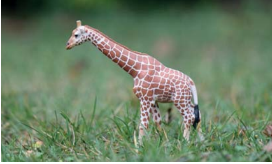
Abb. 3.5 Sie befinden sich auf einer Fotosafari, und eine Giraffe galoppiert an Ihnen vorbei. Der Modus »Servo« wird dem Tier ohne Probleme folgen.