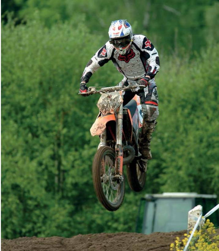
Abb. 3.10 Motocross – die Fahrer sind sehr schnell, bei den Sprüngen entsteht eine schnelle vertikale Bewegung, die kurz zum Stillstand kommt, danach geht es wieder nach unten. Positive Werte für die Nachführung der Beschleunigung lassen den Autofokus auf solche Veränderungen schneller reagieren.