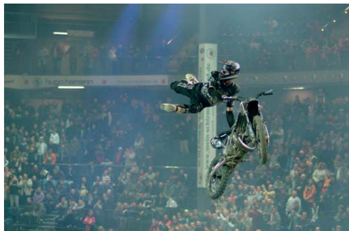
Abb. 3.24 Freestyle-Motocross – es gibt keine Hindernisse oder Störungen, es ist klar, wo der Fahrer auftauchen wird. Was Sie aber vorher nicht wissen, ist, welche Figur er zeigen wird. Die Bewegungen sind sehr unterschiedlich, weshalb Sie die Nachführung auf einen hohen Wert setzen.

In meinen Augen ist Case 4 der anspruchsvollste, und es bedarf einiger Übung, ihn richtig zu verwenden. Dass Übung den Meister macht, ist aber nichts Neues.