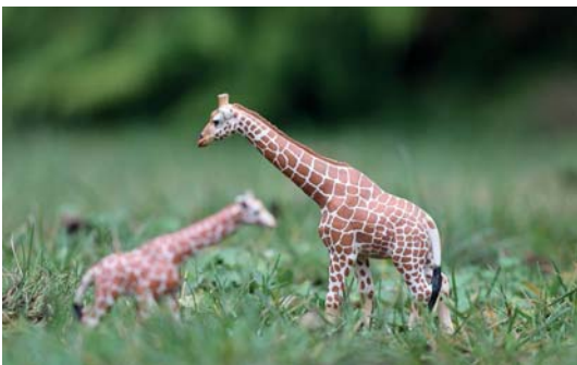
Abb. 3.9 Nun kann es passieren, dass da gar keine Bäume sind, sondern plötzlich eine junge Giraffe auftaucht, die noch ein wenig unbeholfen herumläuft. Sie möchten jetzt das Giraffenfohlen fotografieren. In diesem Fall helfen positive Werte für »AI Servo Reaktion«, damit der AF schnell wechselt. (Oder Sie setzen den Fokus nach Unterbrechung neu.)