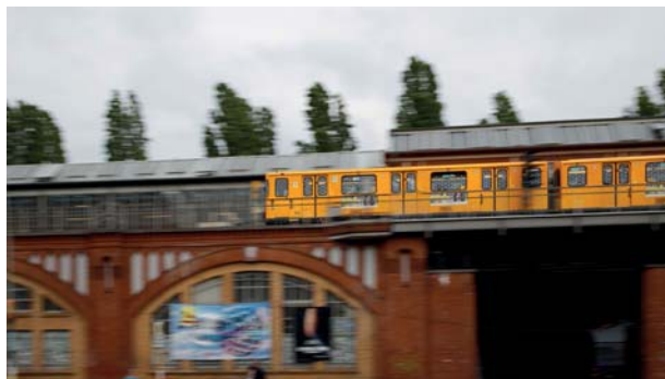
Abb. 3.16 Je nach verwendetem Objektiv erkennt der IS den Mitzieher automatisch (einige RF-Objektive) oder lässt sich manchmal per Schalter in den Mitzieher-Modus umschalten (Super-Teleobjektive EF), es werden dann nur noch vertikale Bewegungen korrigiert.

Die verschiedenen Zonen sind eher nicht geeignet, da dort alle Felder gleichberechtigt sind und die Gefahr bestünde, dass der Autofokus sich zu sehr auf das der Kamera am nächsten gelegene Vorderrad fixiert.