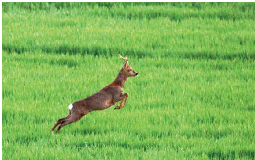
Abb. 3.20 Für so ein Motiv haben Sie nur sehr wenig Zeit. Es taucht spontan und unerwartet auf und ist schnell wieder weg. Mit Case 3 sind Sie auf solche Begegnungen gut vorbereitet.

Dabei spielt es keine Rolle, ob das Ziel selbst unerwartet plötzlich auftaucht oder ob Sie mit der Kamera schnell die Motive wechseln. Auch im letztgenannten Fall soll der Autofokus auf die Veränderung möglichst schnell reagieren und dabei das Motiv nach