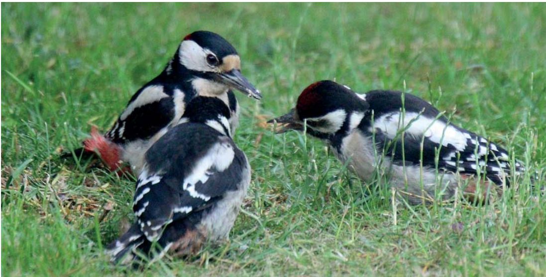
Abb. 3.22 Bei so einem seltenen Anblick haben Sie oft nur eine einzige Chance. Ich wusste zwar, dass bei uns Buntspechte nisten, aber die Fütterung der Jungen habe ich nur ein einziges Mal gesehen. Nur die blitzschnelle Reaktion des Autofokus hat diese Aufnahme möglich gemacht.

Wenn Motive sehr spontan auftauchen und dabei gleichzeitig die Geschwindigkeit rapide ändern, können Sie auch versuchen, Nachführ(ung) Beschl(euni-gung)/Verzög(erung) auf +2 zu setzen.