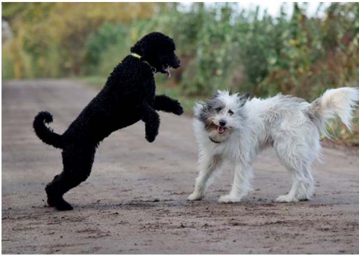
Abb. 3.11 Die beiden spielenden Hunde bewegen sich sehr schnell und schlagen einen Haken nach dem anderen, eine konstante Bewegung ist für den Autofokus nicht erkennbar. Über die Einstellung »Nachführ(ung)/Beschleunigung/Verzögerung« mit hohen Werten ( +1 oder +2 ) weiß der Autofokus, dass er auf Veränderungen der Bewegungsrichtung schnell reagieren muss.

Genau genommen ist dies eine Art Feintuning für AI Servo Reaktion . Hohe Werte erhöhen den Toleranzbereich bei Abweichungen von der vorausgerechneten Geschwindigkeit. So sind hohe Werte zum Beispiel bei Läufern sinnvoll, da sich deren Beine und Arme schneller oder langsamer als der Körper bewegen. Geraten sie in den Fokus, können Messwerte entstehen, die von den erwarteten Werten abweichen.