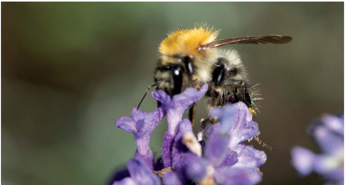
Abb. 3.1 Ein Fehlfokus liegt vor, wenn der Autofokus der Kamera fertig fokussiert hat (hier auf den Kopf der Biene), die resultierende Schärfenebene aber davor oder dahinter liegt. Zur Verwendung an einer DSLR muss dieses Objektiv justiert werden. An der EOS R5 gehören diese Fehler der Vergangenheit an.

Sollte Ihr Objektiv an der EOS R5 also einen Fehlfokus aufweisen, dann ist es tatsächlich defekt.