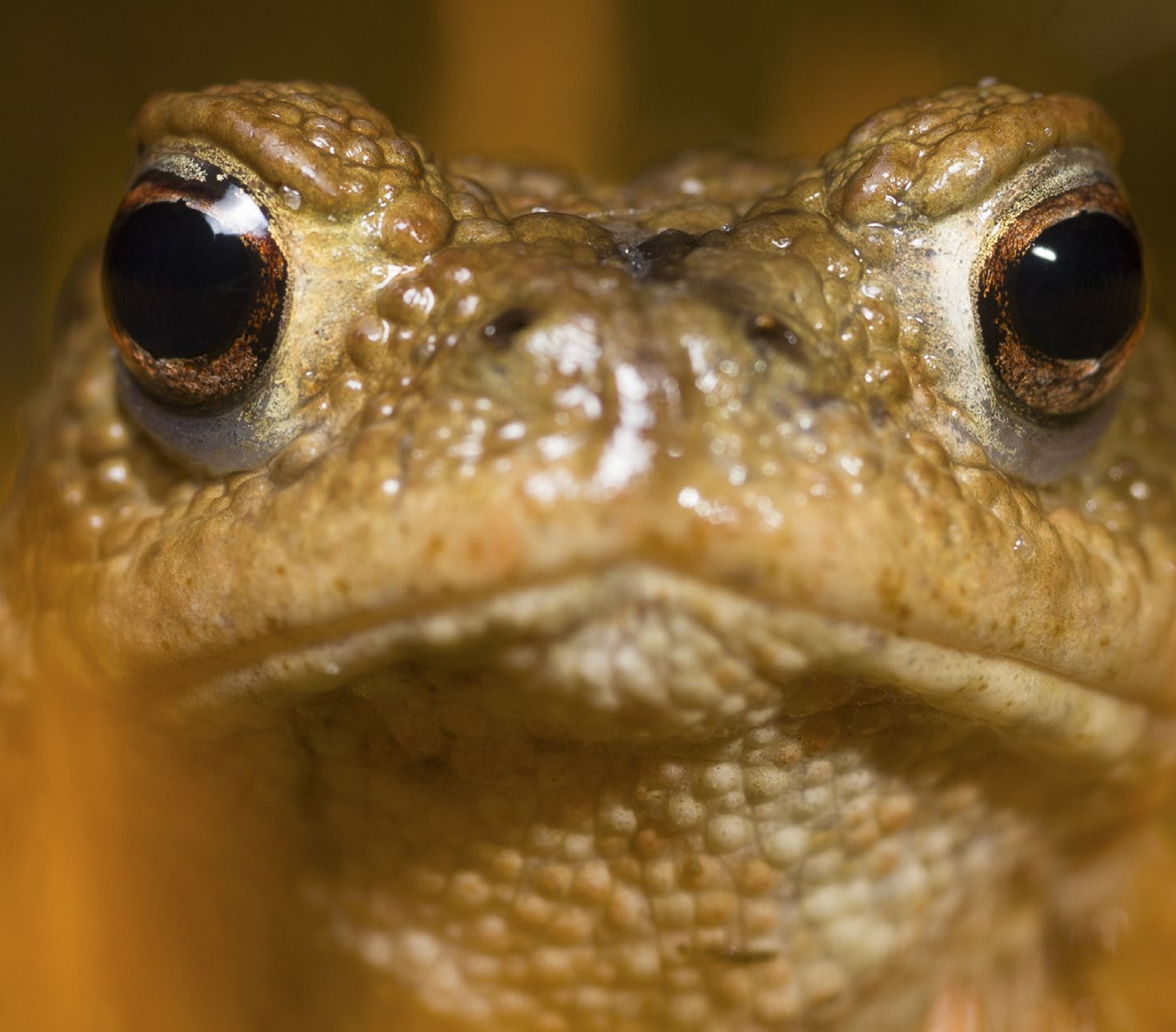
Porträt einer Erdkröte. Diese Aufnahme entstand mit beiderseitigen Blitzgeräten, um Schlagschatten zu vermeiden. | Bergerheide | 1.5.2006 | Paul van Hoof | Nikon D70 mit Nikkor 105 mm 1:2,8, 1/500 s, Blende 11, ISO 200, zwei Blitzgeräte, Winkelsucher