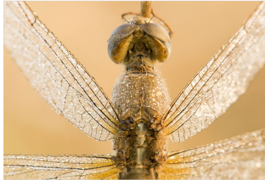
Frühes Morgenlicht verleiht einem Foto eine warme Stimmung. Morgens haben Sie außerdem die Chance, Tau vorzufinden, wie auf diesem weiblichen Exemplar einer Feuerlibelle. | La Brenne (Frankreich) | 31.8.2009, 7:53 Uhr | Nikon D300 mit AF-S Micro-Nikkor 105 mm 1:2,8 G IF-ED VR, 1/30 s, Blende 16, ISO 400

Noch weniger Licht findet man im Schatten vor. Das Licht fällt dann nur noch indirekt auf das Motiv, wodurch es auch etwas kühler (blauer) wird als bei direkter Beleuchtung. Dies lässt sich mit dem Weißabgleich sehr gut ausgleichen. Der geringeren Lichtmenge begegnet man mit längeren Verschlusszeiten und höheren ISO-Zahlen, und so kann man auch im Schatten wunderbar Makrofotografie betreiben. Jedoch ist der eine Schattenbereich nicht wie der andere, denn anders, als man vielleicht denken würde, ist der Schatten bei Sonnenlicht etwas dunkler als der Schatten bei Bewölkung, weil durch die Streuung der Wolken mehr Licht in die Schattenbereiche fällt.