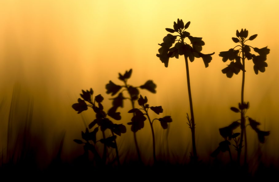
Wiesen-Schaumkraut bei Sonnenuntergang. Mit einem Teleobjektiv bekommt man relativ wenig Hintergrund aufs Bild, wodurch man den am stärksten gefärbten Anteil des Lichts nutzen kann. | Arnheim | 29.4.2013, 20:37 Uhr | | Nikon D800 mit AF-S Nikkor 200–400 mm VR auf 330 mm 1:4, 1/800 s, Blende 5,6, ISO 100, Kamera auf dem Boden, Winkelsucher