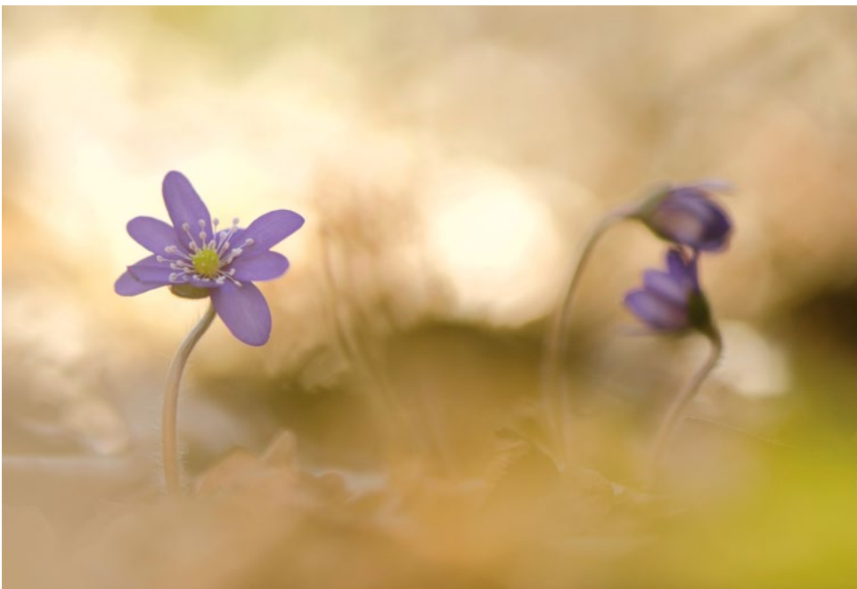
Die Leberblümchen stehen im Schatten, doch durch den sonnenbeschienenen Hintergrund entsteht eine ganz besondere Lichtstimmung. | Jakobsberg (D) | 1.4.2013 12:41 Uhr | | Nikon D7000 mit AF-S Micro-Nikkor 105 mm 1:2,8 G IF-ED, 1/250 s, Blende 3,2, ISO 200