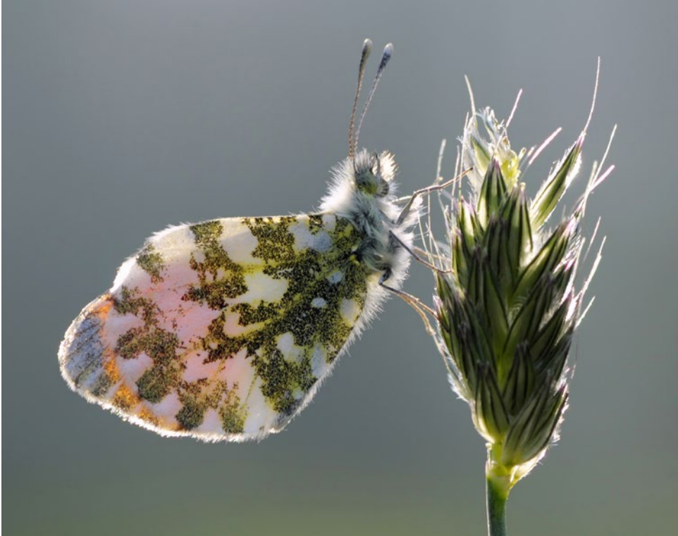
Aurorafalter, im morgendlichen Gegenlicht fotografiert. Durch den relativ dunklen Hintergrund werden die Härchen gut sichtbar. | De Brand | 25.4.2010, 8:18 Uhr | | Nikon D300 mit AF-S Micro-Nikkor 105 mm 1:2,8 G IF-ED, 1/125 s, Blende 8, ISO 160, Stativ