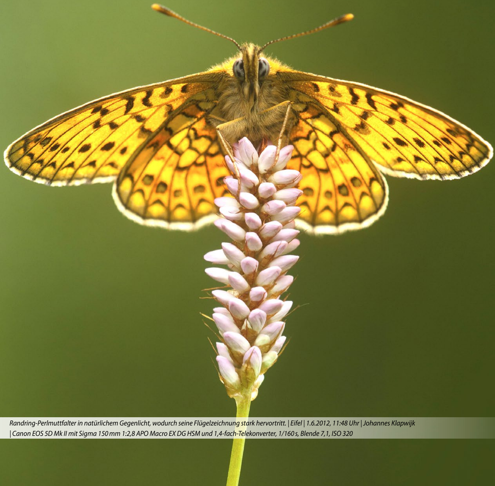
Randring-Perlmutterfalter in natürlichem Gegenlicht, wodurch seine Flügelzeichnung stark hervortritt. | Eifel | 1.6.2012, 11:48 Uhr | Canon EOS 5D Mk II mit Sigma 150 mm 1:2,8 APO Macro EX DG HSM und 1,4-fach-Telekonverter, 1/160s, Blende 7,1, ISO 320