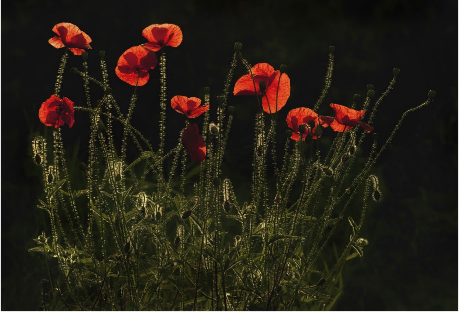
Bei diesem Bild sorgte eine Belichtungskorrektur von -2 \frac{2}{3} Blenden für einen dunklen Hintergrund und starken Kontrast zu den Mohnblumen. Ohne diese Korrektur hätte die Kamera den Hintergrund grau dargestellt und die Mohnblumen überbelichtet. | Ermelo | 16.7.2013, 8:01 Uhr | | Nikon D300 mit Tokina 100 mm 1:2,8 AT-X Pro D, 1/2500 s, Blende 8, ISO 400

Doch auch ein Pilz in einem dunklen Wald wird so belichtet, dass er ein mittleres Grau aufweist, obwohl man vielleicht eigentlich die düstere Atmosphäre beibehalten wollte.