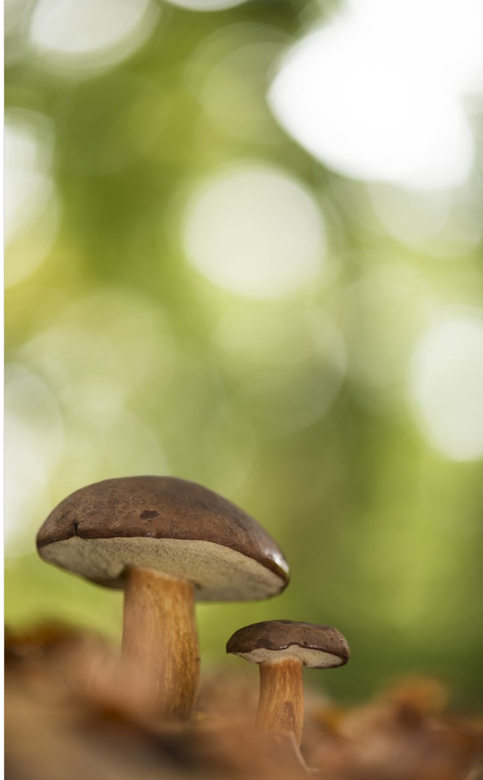
Das Licht fiel von hinten durch das Blätterdach. Durch die große Blendenöffnung sind die unscharfen Lichtflecken weich und rund und weisen keine Kanten auf, die durch die Blendenlamellen verursacht werden könnten. Die Maronen wurden durch einen Aufhellblitz leicht angeleuchtet. | Arcen | 13.10.2012, 11:04 Uhr | | Nikon D800 mit AF-S VR Micro-Nikkor 105 mm 1:2,8 G EF-ED, 1/60s, Blende 3,0, ISO 400, Stativ, Aufhellblitz

Der Blitz, als Gegenlicht eingesetzt, ergibt häufig spannende, dramatische Fotos. Dieser Effekt ist zwar nicht immer leicht umzusetzen, weil das Blitzlicht dabei leicht Streulicht im Objektiv