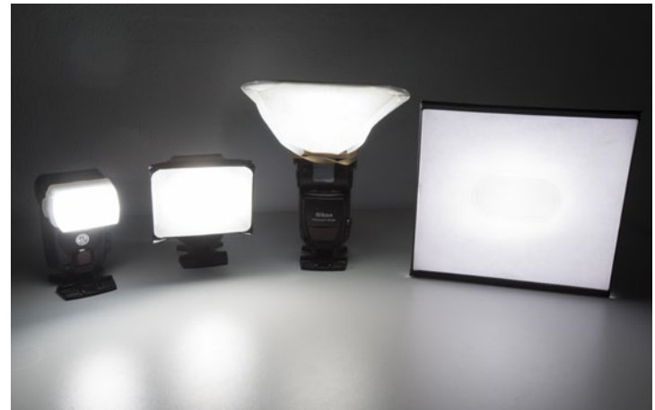
Diverse Softboxen und Diffusoren in der Reihenfolge ihrer Streuwirkung. Bei den Blitzgeräten ist die gleiche Leistung eingestellt (1/16). Ganz links sieht man einen mitgelieferten Diffusoraufsatz (Nikon); es folgen drei Produkte der Firma Lumiquest.

Um dem harten Blitzlicht entgegenzuwirken, kann man Diffusoren oder Softboxen einsetzen. Beide bestehen aus milchig durchscheinendem Material, das vor die Blitzröhre montiert wird. Der Effekt ist der gleiche wie beim Diffusor, mit dem man hartes Sonnenlicht streut. Blitz-Diffusoren gibt es in zahlreichen Ausführungen zu kaufen, Sie können sich aber auch selbst einen Diffusor aus weißem