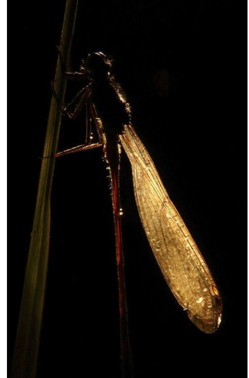
Die Silhouette einer Großen Pechlibelle wird im Gegenlicht noch durch den dunklen Hintergrund verstärkt. | Leiden | 10.6.2011, 23:18 Uhr | | Panasonic DMC-FZ18 auf 5,7 mm, 1/80 s, Blende 2,8, ISO 100