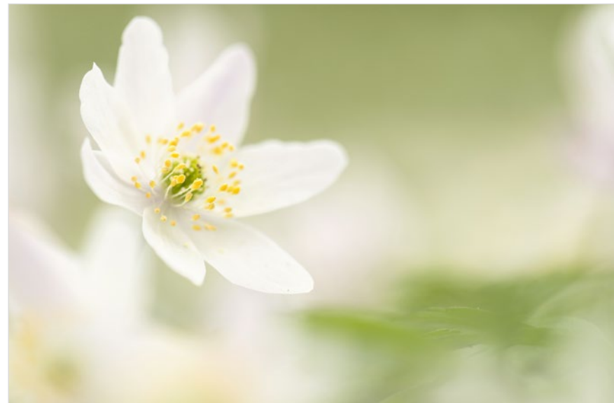
Weißer Blumen, wie dieses Buschwindröschen, lassen sich am besten bei leichter Bewölkung fotografieren. In der Sonne brennt das Weiß schnell aus. | 19.4.2013, 11:38 Uhr | | Nikon D800 mit AF-S Micro-Nikkor 105 mm 1:2,8 G IF-ED VR, 1/200 s, Blende 5,6, ISO 400