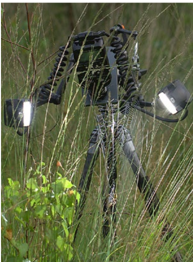
Ein weiteres Beispiel eines Makroblitzes, hier der MT-24 EX Twin Light von Canon im entfesselten Einsatz auf einem Stativ, um ein Spinnennetz eindrucksvoll in Szene zu setzen. Oben das Ergebnis. | Geldermalsen | 6.8.2013, 6:58 Uhr | Leon Baas | Canon EOS 7D mit Canon EF 100 mm 1:2,8 Macro IS USM, 1/100s, Blende 5,0, ISO 100

Mit einem Ringblitz lässt sich das Motiv auch aus sehr geringem Aufnahmeabstand gut ausleuchten. Mit einem Aufsteckblitz würde das Objektiv einen Schatten auf das Motiv werfen. | Meinte Schelvis