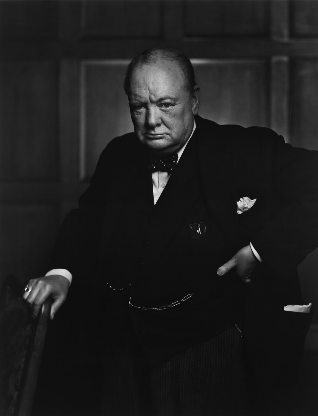
Yousuf Karshs Porträt von Sir Winston Churchill, 1942