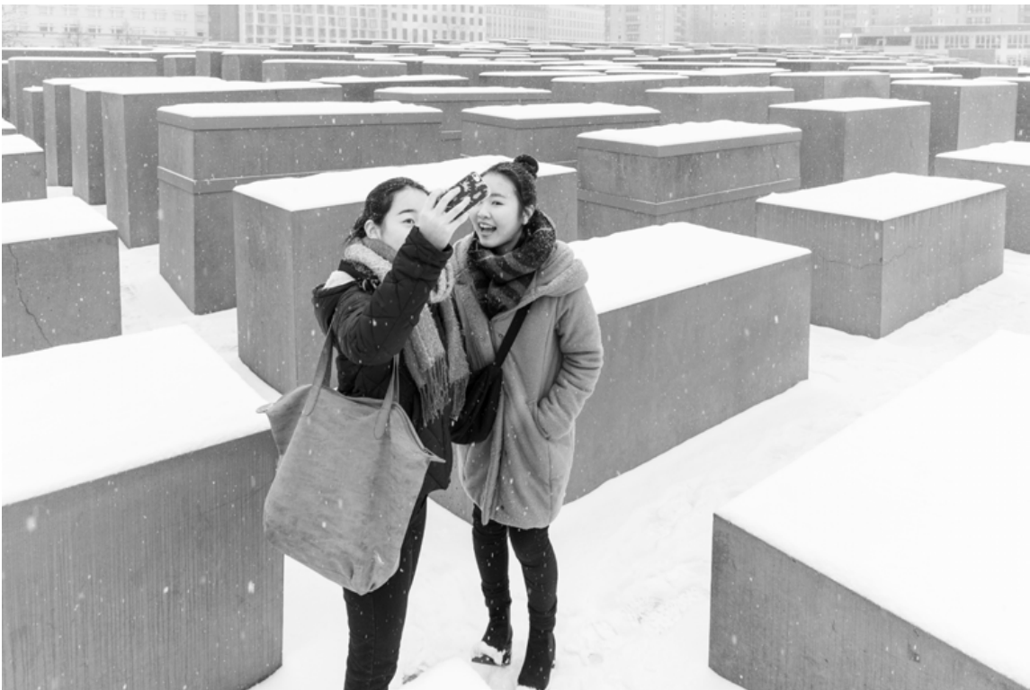
1-3 Streetfotografie reflektiert die Zeitgeschichte. (MUW)