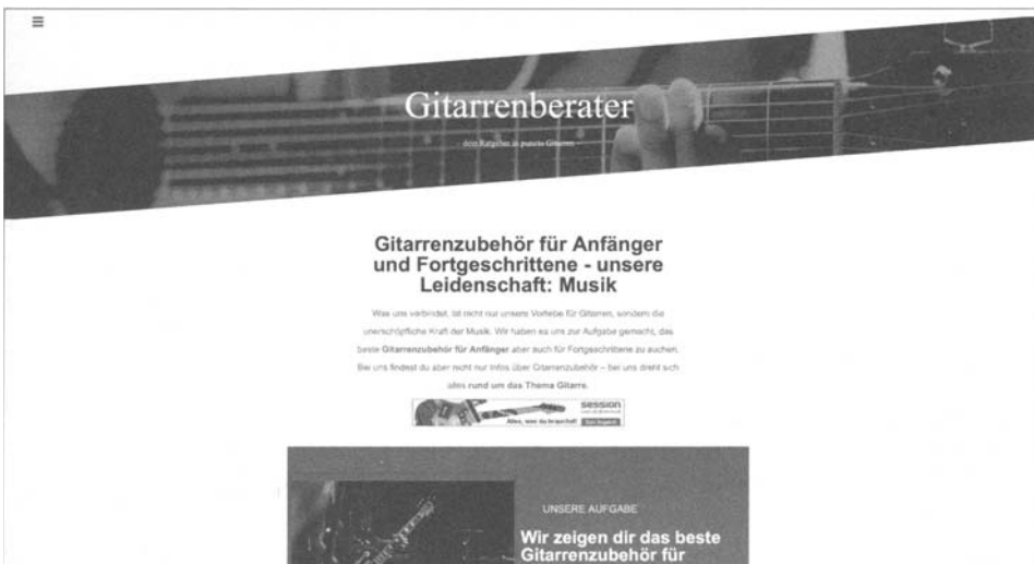
Abb. 2: Website https://gitarrenberater.de

Wie bei der Darstellung des Aufbaus des Buches zu erkennen ist, orientieren sich nahezu alle Themen an der Praxis und sollen dadurch für den Leser einen Mehrwert bieten. Alle wichtigen Themen werden aber nicht nur beschrieben, sondern auch an einem konkreten Website-Projekt aus der Praxis umgesetzt. Die Website, die dafür parallel zum Buch entwickelt wurde, ist unter der Domain https://gitarrenberater.de erreichbar. Abbildung 2 zeigt einen Screenshot der Startseite.