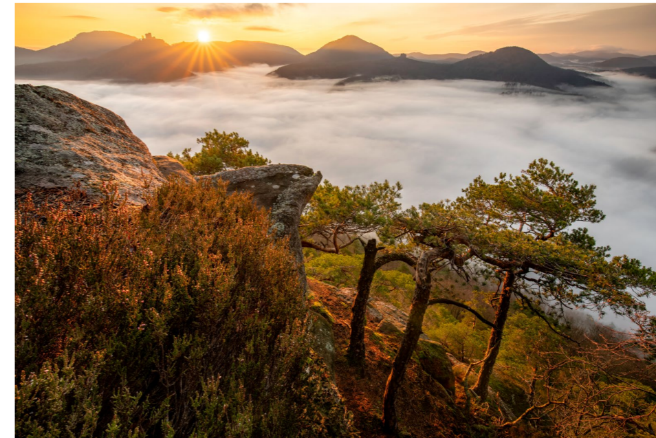
15 mm | f2,8 | 120 s | ISO 1600 | Stativ

Wetter und Licht Der Felsen bietet sich vor allem für die Fotografie am Morgen an. Vom Felsen fotografieren Sie nach Südosten. Von November bis Februar geht die Sonne bei klarem Himmel hinter den drei Burgen auf. Außerdem ist dann auch mit Morgenröte über den Burgen zu rechnen. Im Winterhalbjahr können Sie in jenen klaren Nächten mit Nebel rechnen. Die Webcam »Weinbiet« zeigt Ihnen, ob Nebel möglich ist. Ganzjährig werden die Burgen von der untergehenden Sonne angestrahlt. (BW)