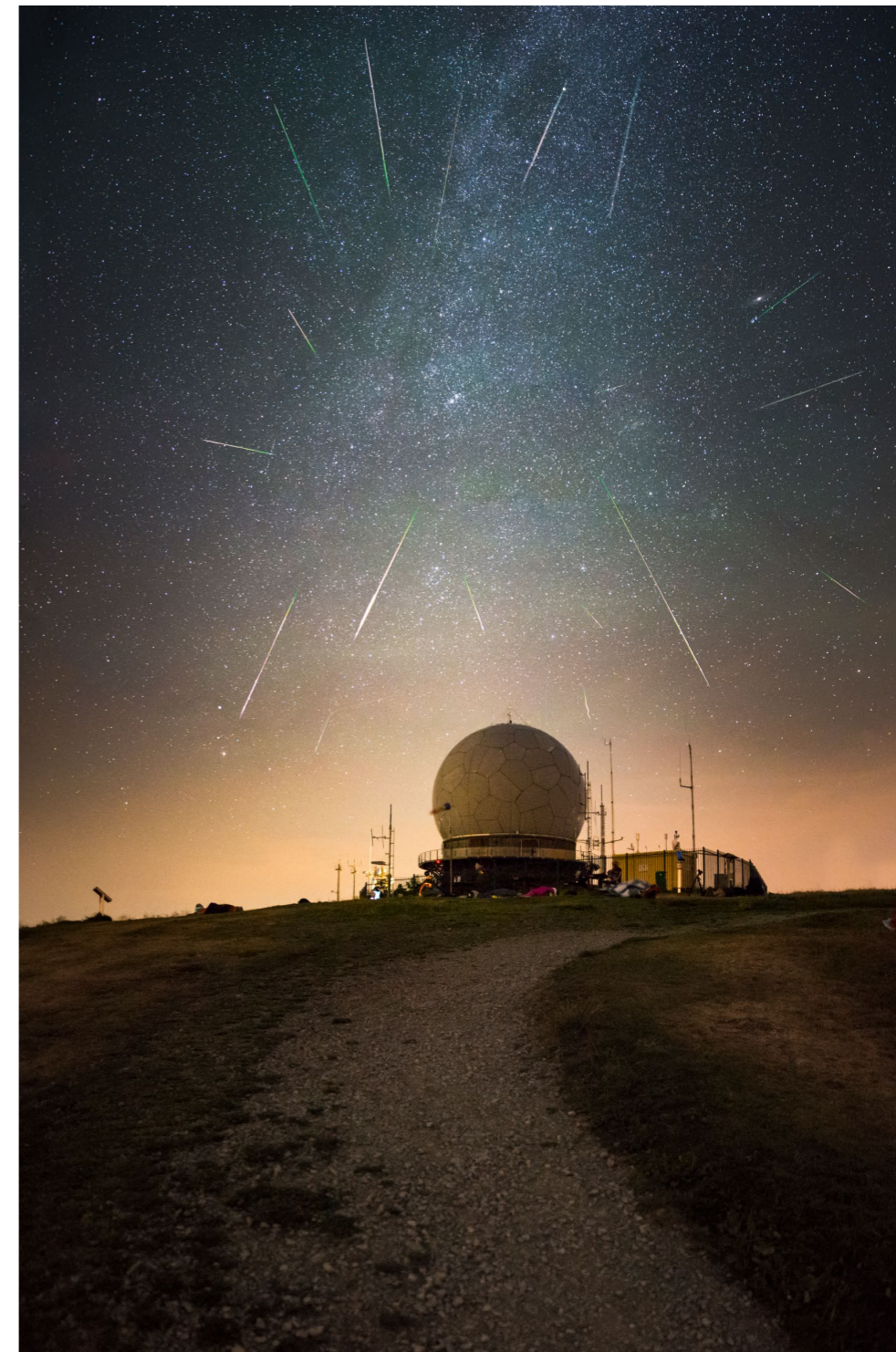
15 mm | f2,8 | 30 s | ISO 3200 | Stativ, Fotomontage der Sternschnuppen

Zum dritten Spot müssen Sie etwas laufen, denn der Pferdkopf ist 20 min Fußweg vom Gipfel entfernt. Das ist eine Felsformation, die einen Blick nach Westen über die Täler der Rhön bietet. Ganzjährig fantastisch nutzbar für ein Abendrot oder die Blaue Stunde. Bei Nebel blicken Sie von hier am besten über das Nebelmeer. In Ihre Fototasche sollten Sie vom Weitwinkel bis zum Tele einpacken, was Sie haben. Reisen Sie rechtzeitig an, um sich vor Ort nach den Motiven umzuschauen. Im Winter kann der Schnee sehr hoch sein, seien Sie entsprechend ausgerüstet. (BW)