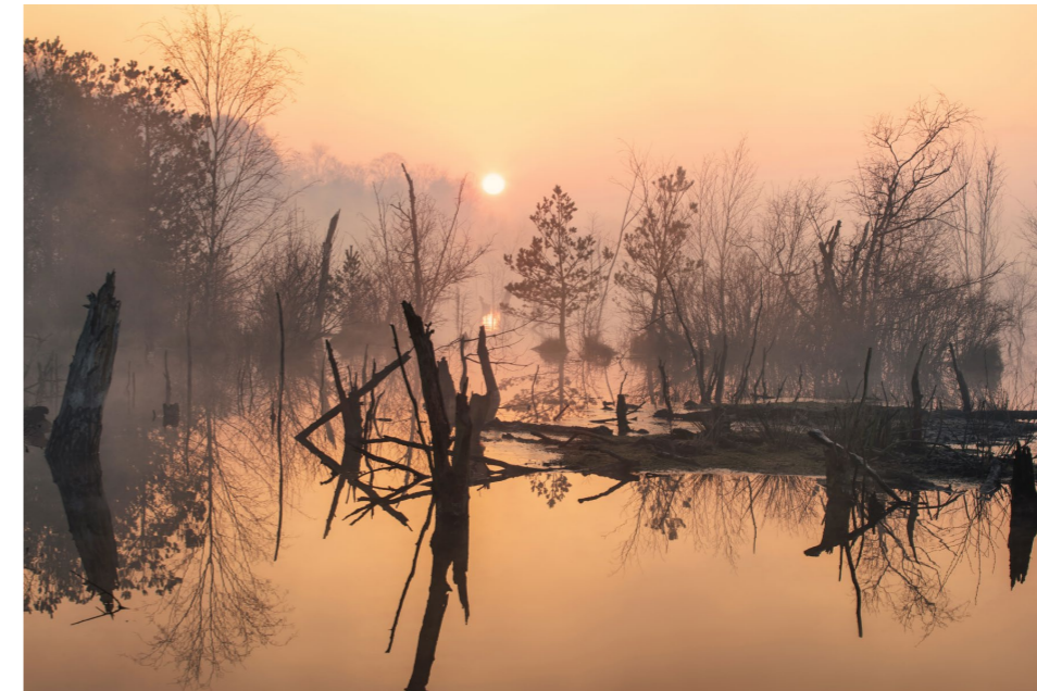
70 mm | f11 | 1/25 s | ISO 100 | Stativ

Wetter und Licht Im Moor bei Sonnenaufgang gibt es häufig Nebelschwaden. Bei Regen sieht die Moorvegetation besonders saftig aus. Auch das flache Licht des Sonnenuntergangs schmeichelt der Landschaft. (KS)