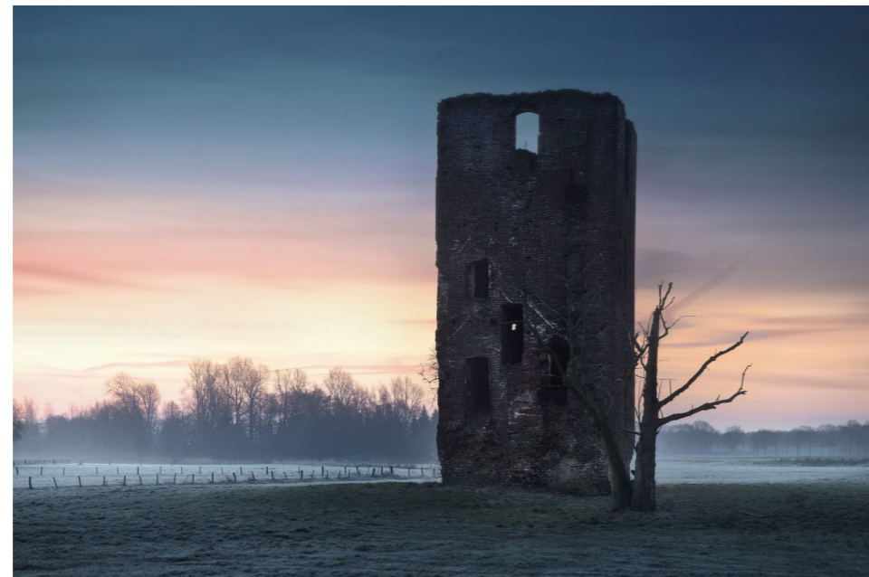
65 mm | f9 | 1s | ISO 200 | Stativ

Wetter und Licht Die leeren Fenster und der vermeintlich einsam stehende Turmstumpf wirken besonders bei leichtem Bodennebel fotogen. Aber auch stürmische Regentage passen zur fast an Schottland erinnernden Stimmung rund um die Ruine. (KS)