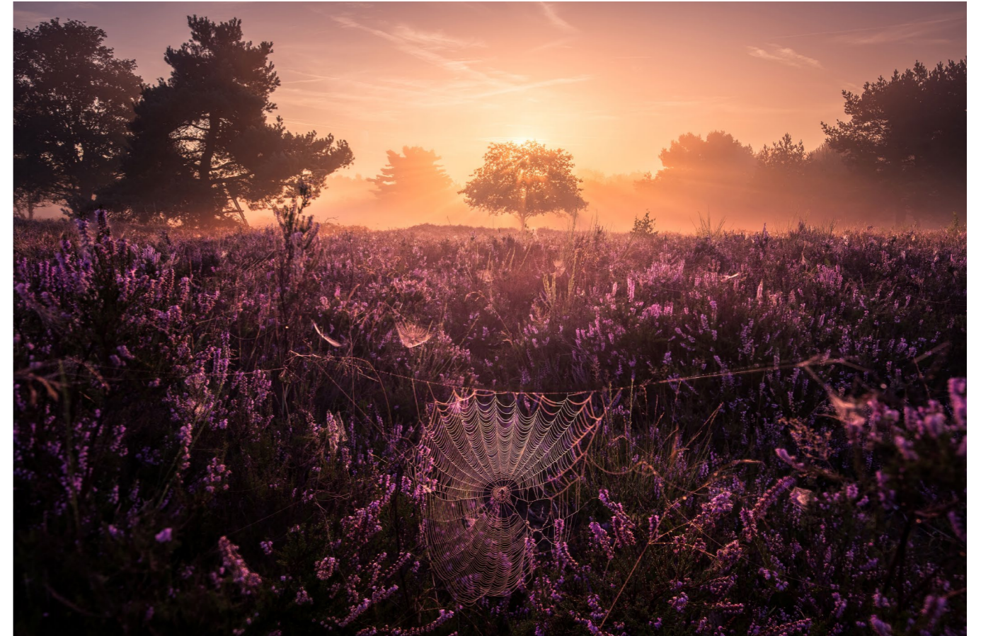
15 mm | f5,6 | 1/50 s | ISO 64 | Stativ

Wetter und Licht Bedingt durch das Wetter ist die Heideblüte manchmal früher, manchmal später und nicht immer so schön ausgeprägt. Der Höhepunkt ist im August. Sie können sich im Internet unter »#MehlingerHeide« aktuelle Fotos anzeigen lassen, um den Stand der Blüte zu erfahren. Natürlich finden sich auch davor und danach viele Motive in der Heide. Vor Ort haben Sie einen 360-Grad-Blick. Aus diesem Grund können Sie das ganze Jahr über gut die Himmelsröte fotografieren. Das andere Wetterphänomen vor Ort sind Nebelschleier. Diese bilden sich ab August bis Mai sehr gern auf dem sandigen Boden. Nach windstillen und sternenklaren Nächten haben Sie gute Chancen, Nebelschleier vor Ort zu finden. Zur Fotografie in der Nacht ist die Heide leider ungeeignet. Kaiserslautern und der amerikanische Militärflughafen Ramstein erzeugen eine enorme Lichtverschmutzung, sodass Sie keine Sterne sehen können. (BW)