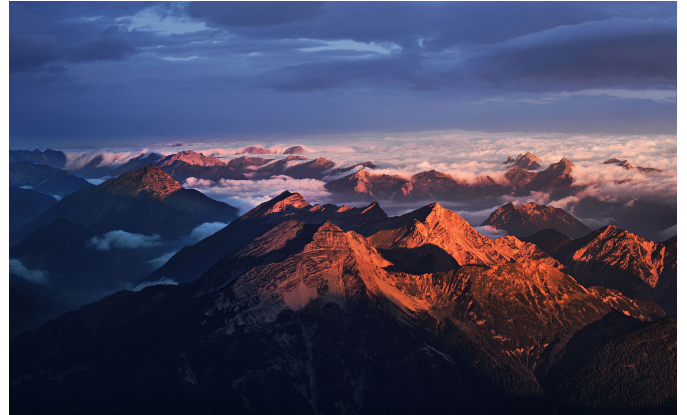
70 mm | f11 | 1/5 s | ISO 100 | Stativ

Wetter und Licht Aufgrund ihrer Höhe und der leichten Erreichbarkeit bietet die Zugspitze Motivgelegenheiten, die es so in Deutschland kein zweites Mal gibt. Dazu zählen Inversionswetterlagen im Herbst und Winter, aber auch enorme Schneehöhen im Winter. Wenn der Gipfel in Wolken gehüllt ist, lohnt sich ein Besuch eher nicht. Im Sommer werden am Wochenende von einer der Bergbahnen gelegentlich Sonnenaufgangstouren angeboten. Schneller kommen Sie in Deutschland nicht an einen hochalpinen fotografischen Morgengruß. (KS)