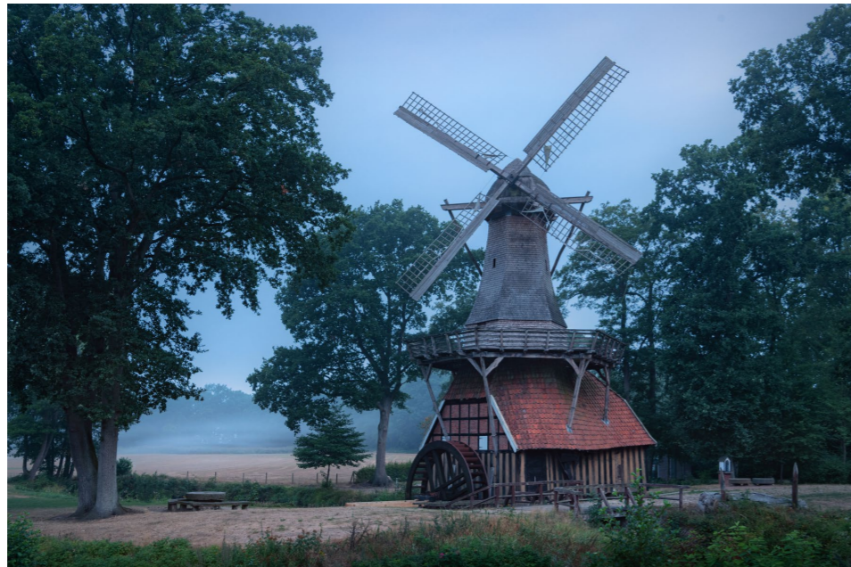
35 mm | f9 | 15 s | ISO 400 | Stativ

Wetter und Licht Geheimnisvoll mutet diese ungewöhnliche Mühle an einem Nebelmorgen an. Aber auch im flachen Abend- und Morgenlicht macht das Gebäude eine gute Figur. (KS)