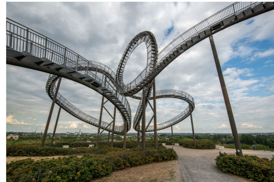
15 mm | f5,6 | 1/640s | ISO 64 | Stativ

Wetter und Licht Da die Skulptur Ihnen einen Rundumblick und ein um 360 Grad begehbares Motiv bietet, können Sie ganzjährig eine Himmelsröte fotografieren. Gleichzeitig ist es möglich, das Ruhrgebiet in der Ferne einzufangen. Zur Blauen Stunde und in der Nacht ist Tiger and Turtle beleuchtet. Bei flachem Nebel können Sie von oben eine Aussicht finden. Den Sonnenaufgang und -untergang können Sie in alle Himmelsrichtungen fotografieren. (BW)