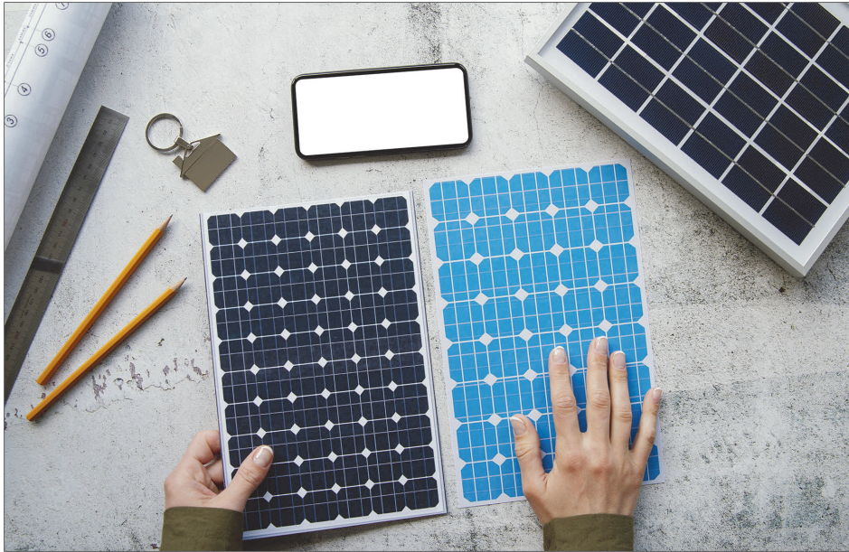
Abbildung 6.1 Die verschiedenen Solarmodultypen

Beide Typen haben ihre Stärken und Schwächen, keine von beiden ist per se besser oder schlechter als die andere. Polykristalline Solarmodule sind etwas günstiger und nicht ganz so effizient wie monokristalline Solarzellen. Allerdings haben sie eine höhere Lebensdauer, ihre Degradation ist etwas geringer.