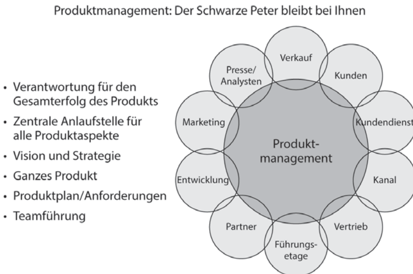
Abbildung 1.1: Die Rolle des Produktmanagements; © 2017, 280 Group LLC.

Und wo ordnet sich da das Produktmanagement ein? Man kann es sich zum Beispiel so vorstellen, dass es – wie es in Abbildung 1.1 zu sehen ist – in der Mitte zwischen allen Unternehmensabteilungen und externen Gruppen wie Kunden, Presse, Analysten und Partnern angesiedelt ist. Jede der umgebenden Gruppen kennt zwar ihre eigene Rolle für den Unternehmenserfolg, aber das Produktmanagement ist die einzige Gruppe, die eine ganzheitliche Perspektive einnimmt und versteht, wie die einzelnen Komponenten zusammenpassen.