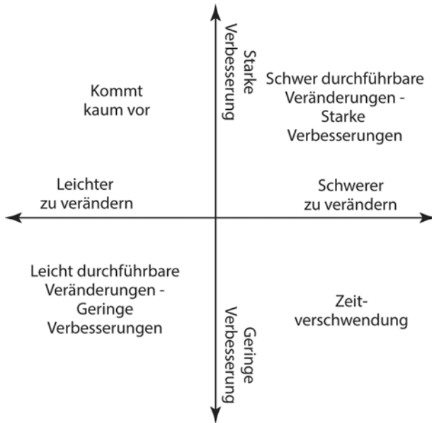
Abbildung 1.1: Der optimale Bereich für Veränderungen

Sobald Sie diesen Bereich gefunden haben (und die Bereiche, die auf der einen oder anderen Seite danebenliegen), sind Sie so weit, mit der Übernahme der gewählten agilen Rahmenstrukturen, Prozesse und Prinzipien zu beginnen.